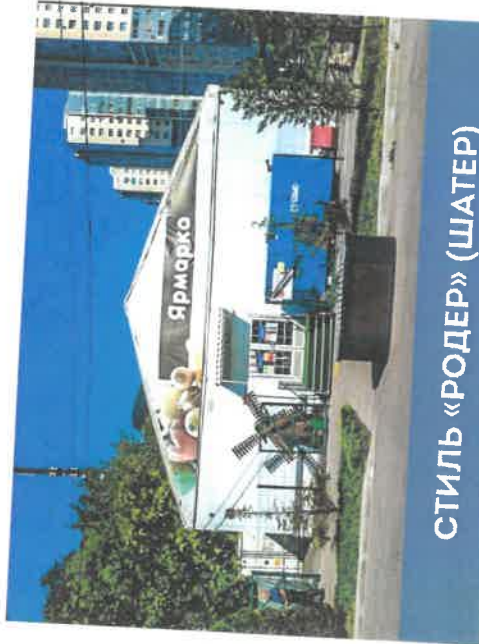
СТИЛЬ «РОДЕР» (ШАТЕР)

САО, Хорошевский, проезд Березовой рощи, вл. 2 ЗАО, Очаково-Матвеевское, ул. Матвеевская, вл. 2