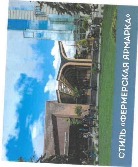
СТИЛЬ «ФЕРМЕРСКАЯ ЯРМАРКА»

ЦАО, Арбат, Б. Николопесковский пер., вл. 8 ЦАО, Басманный, ул. Бакунинская, вл. 24 САО, Дмитровский, пересечение Дмитровского ш. и ул. Лобненская СВАО, Булырский, ул. Милашенкова, вл. 14 СВАО, Ярославский, Ярославское шоссе, вл. 111 СВАО, Отрадное, Алтуфьевское шоссе, вл. 30Г СВАО, Отрадное, ул. Отрадная, вл. 16 ВАО, Южное Медведково, ул. Полярная, вл. 10 ВАО, Перово, Зеленый проспект, вл. 2 ЮВАО, Кузьминки, ул. Юных Ленинцев, вл. 52 ЮВАО, Рязанский, ул. Академика Скрябина, вл. 4 ЮАО, Орехово-Борисово Северное, ул. Домодедовская, вл. 12 ЮАО, Бирюлево Восточное, ул. Михневская, вл. 9/1 ЮАО, Царицыно, Пролетарский пр-т, вл. 24 ЮАО, Бирюлево-Западное, Булатниковский проезд, вл. 14 ЗАО, Раменки, ул. Раменки, вл. 3 ЗАО, Фили-Давыдково, ул. Ватутина, вл. 18к2 ЗАО, Ивановское, ул. Челябинская, вл. 15 ЗАО, Можайский, Барвихинская ул., вл. 6 СЗАО, Хорошово-Мневники, ул. Саляма Адила, вл. 4 ЮАО, Зябликово, Ореховый бульвар, вл. 24